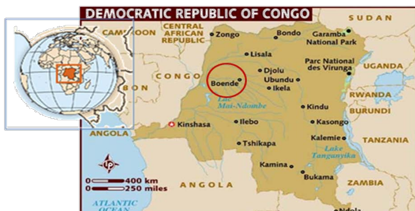
Mapa 2: Distribució geogràfica del brot de FHVE a la República Democràtica del Congo.